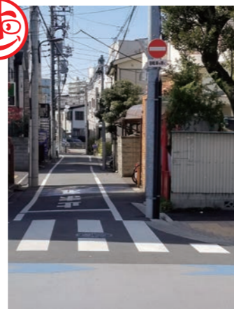
進入禁止標識 池袋3丁目

ここは平成30年3月に開通した「みたけ通り」に面した一方通行出口です。 一方通行出口は基準により「進入禁止標識」の設置省略が可能であり、この交差点についても省略されておりました。しかし、進入逆走する車両が多く、危険性を訴える声が多いことから設置に至りました。