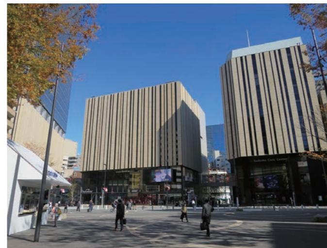
ハレザ池袋（東京建物BrilliaHALL、としま区民センター）

※令和2年7月に、ハレザタワー（旧区役所庁舎跡地→シネコン、オフィス棟） を含めグランドオープンします。