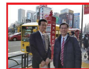
呉副区長とイケバス初乗車