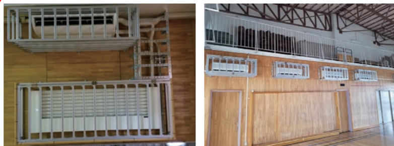
体育館冷暖房設置事業

11月に、全区立小中学校、西部区民事務所、みらい館大明の体育館に、冷暖房設備の設置が完了しました。 引き続き、機器によるケガが発生しないよう要望しております。