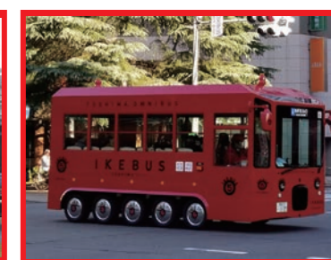
走行中のイケバス