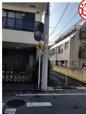
カーブミラー 池袋4丁目

② ここは池袋4丁目です。 T字路から一方通行道に出る際に見通しが悪いことから設置。