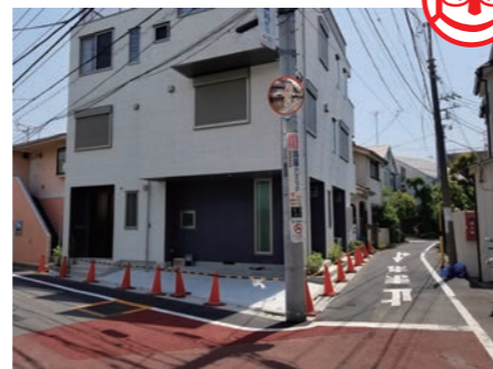
カーブミラー 千早2丁目

③ 千早2丁目の出会い頭の事故が多い交差点。 一方通行を逆走してくる自転車が見えにくいとの指摘を受けて設置。