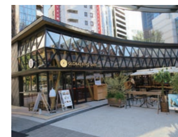
グローバルリング内カフェ