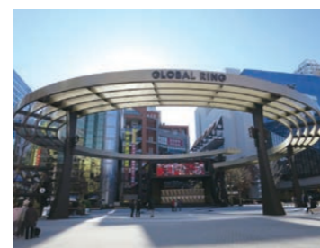
池袋西口公園野外劇場グローバルリング