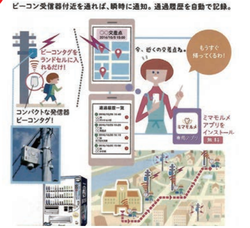
ビーコン受信機を活用 安心見守りネットワーク