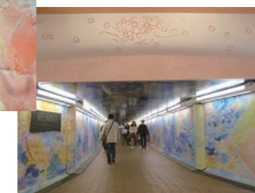
ウィロード西口側より