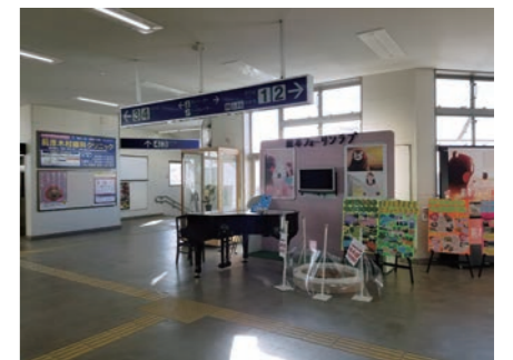
糸島市筑前原駅の「駅ピアノ」