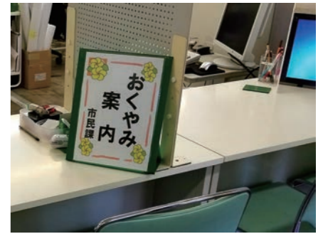
糸島市役所おくやみ案内コーナー