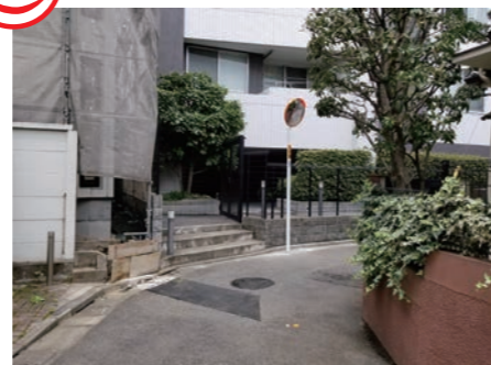
カーブミラー 高松2丁目

① 建て替えによる狭わい道路の拡幅により、車両の出入りが多くなってきた高松2丁目のクランク道。接触事故が増えていることから民間宅地での建築工事の状況をみながら設置。