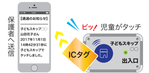
学童クラブ入退室管理システム