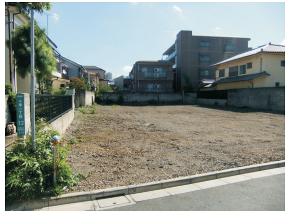
臨時保育所開設予定の千早1丁目区有地