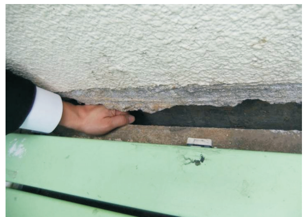
東日本大震災で大きな被害を受けた同校